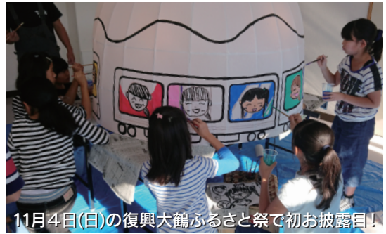
11月4日(白)の復興大鶴ふるさと祭で初お披露目!