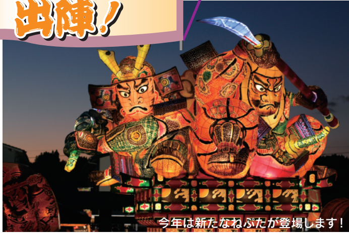
今年は新たなねぶたが登場します!

昨年、災害からの復興を祈念し日田に駆けつけ、その勇壮華麗な姿で市民に勇気と感動を与えてくれた「弘前ねぶた」が今年も日田にやってきます! 日田市からも、「ひょうたん工房」の皆さんと、大鶴・夜明地区の子どもたちが心を込めて作ったランタンと一緒にまつりを盛り上げます!