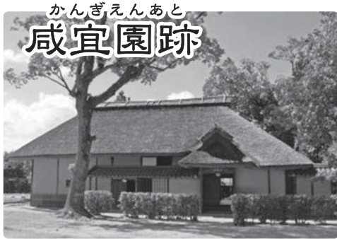
かんぎえんあと 咸宜園跡

「日本遺産」とは、我が国の文化・伝統を語るストーリーを「日本遺産」に認定する仕組みです。「近世日本の教育遺産群」として『咸宜園』や『豆田町』が日本遺産の第1号に認定されました。