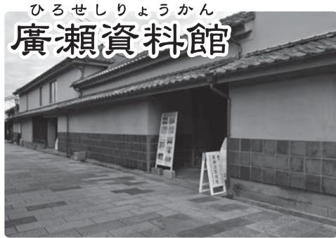
ひろせしりょうかん 廣瀬資料館

江戸時代、出身僧侶が京都の東本願寺高倉学寮の講師となるなど、日田における学問の中心でした。幼少時の淡窓はこの寺の僧侶に学び、その人間形成に影響を受けています。また多くの門下生が長福寺の紹介で咸宜園に入門しました。