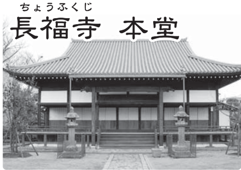
ちょうふくじ 長福寺 本堂

廣瀬淡窓が文化14(1817)年に創設した近世日本最大規模の私塾跡。身分の区別なく塾生を受け入れ、徹底した実力主義で学力を客観的に評価した「月旦評」や塾生に自治を任せる独自の教育方法が評判となり、全国から5,000人を超える入門者を集めました。